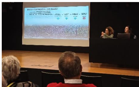
Fig 3. Presentació tècnica

A l'Annex es pot consultar l'argumentari de la presentació de l'avanç de planejament que les tècniques dels Serveis Territorials han presentat a les trobades sectorials realitzades amb les diverses associacions del municipi.