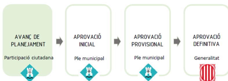
Fig 5. Fases d'aprovació de planejament

Es pregunta pel calendari de la implementació del projecte i s'explica que ara s'està en un procés de recollida de propostes i amb això es pot crear un document d'aprovació inicial o desestimar continuar amb el projecte. A més, no hi ha un període tancat per passar d'unes fases a unes altres, és un procés viu que es pot ajustar segons vagi evolucionant. Després del document inicial encara s'hauria de fer un d'aprovació provisional (tots dos s'haurien d'aprovar al ple municipal), i després fer-ne un d'aprovació definitiva que ha d'aprovar la Generalitat. Llavors, en aquest moment, és quan es pot decidir si realment s'executa o no, perquè cada pas depèn de la voluntat política. Malgrat les explicacions de com funcionen totes les fases del procés d'aprovacions de planejaments urbanístics no es creuen que no hi hagi un temps fixat entre una fase i l'altra, i consideren que s'estan tirant els diners si s'han de redactar aquests documents per no executar-ho.