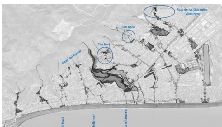
Fig 1. Eixos i punts d'actuació del MPG

En tractar-se d'un projecte de gran abast, que afecta a tota la ciutat i afecta molts sectors (urbanístic, mediambiental, transport...), l'Ajuntament de Castelldefels va iniciar un procés de debat públic per tal d'informar sobre les modificacions del Planejament i debatre les característiques que podrien tenir aquests espais integrats en els eixos.