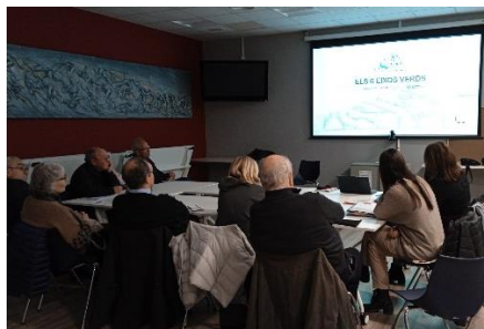
Fig 2. Presentació tècnica

A l'Annex es pot consultar l'argumentari de la presentació de l'avanç de planejament que la tècnica dels Serveis Territorials ha presentat a les trobades sectorials realitzades amb les diverses associacions del municipi.