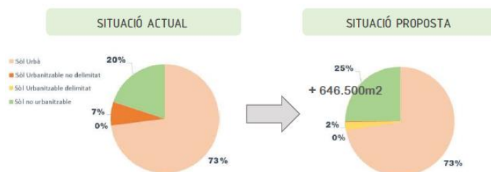
Fig 4. Modificació d'usos de sòl

Al setembre 2022 es va rebre un informe que deia que el creixement de la població ja està arribant als seus màxims. S'ha detectat que el creixement és degut a la gent que ve de fora, i té un alt nivell adquisitiu. En canvi, les franges d'edat entre els 20 i els 40 anys marxen de Castelldefels en cerca d'habitatges més assequibles. A l'Avanç no s'ha donat un número màxim habitatges ni de sostre edificable.