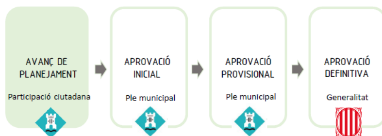
Fig 3. Fases d'aprovació de planejament

L'avanç de planejament no és normatiu, i té dos objectius: per una banda, exposar al públic el document perquè tothom pugui donar la seva opinió i, d'altra banda, és un requisit per fer el tràmit inicial mediambiental . Però no és una proposta que depengui únicament d'aquest ajuntament ni és un projecte constructiu, perquè després de l'aprovació definitiva s'han d'iniciar molts més plans i projectes i ha de passar per moltes legislatures.