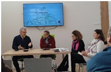
Fig 2. Trobada premsa