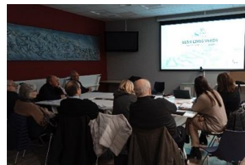
Fig 5. Trobada associacions socioculturals, esportives i solidàries