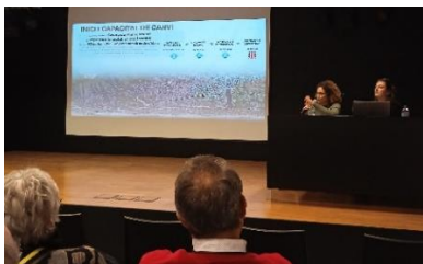
Fig 4. Trobada associacions veïnals