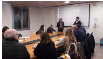
Fig 3. Trobada plataformes